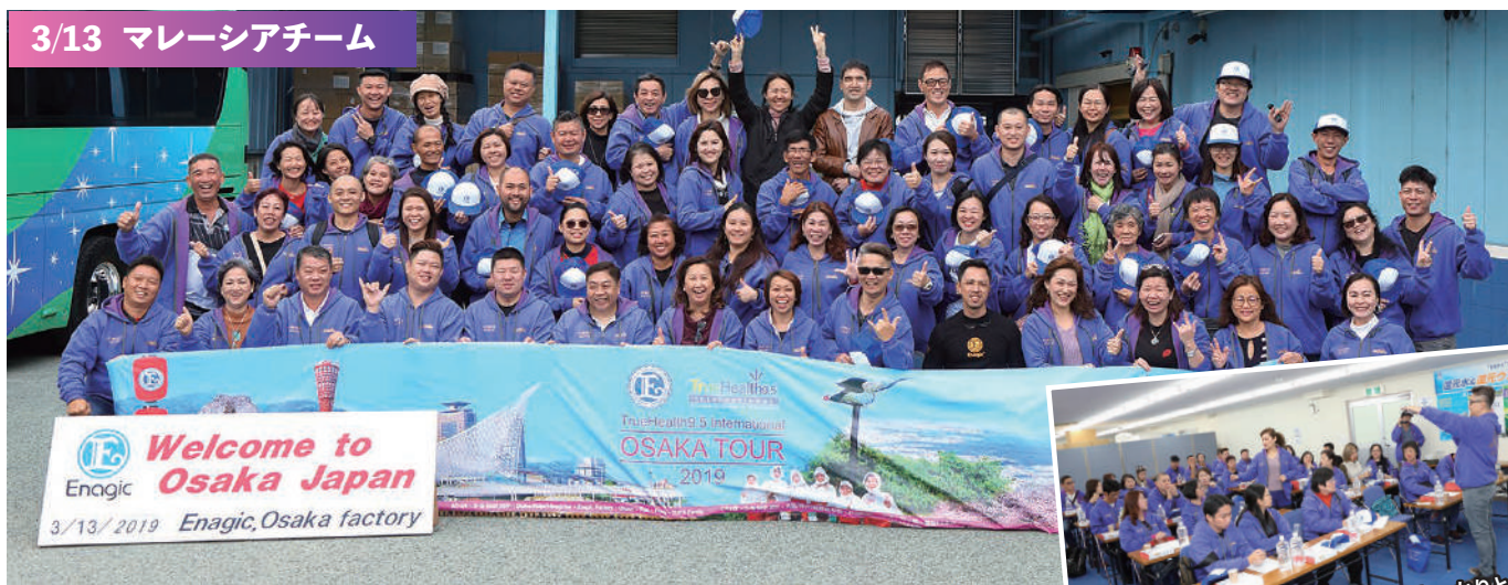
3/13 マレーシアチーム

参加者は合計約400人にも及んだそうで、これは、せっかく日本で開催されるコンベンションに参加したのだから、大阪まで足を延ばして「メイドインジャパン」の現場を見ようという熱意の表われです。受け入れる工場側も忙しさが一段と増すとはいえ、熱意に応えようと準備を整え各国の販売店を熱烈歓迎しました。