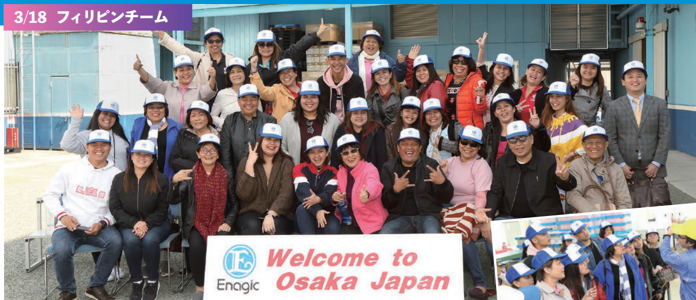
3/18 フィリピンチーム