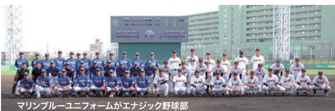
マリンプルーユニフォームがエナジック野球部

昨年、エナジック硬式野球部は巨人軍三軍と闘い勝利しましたが、今年もやりました！ 4月28日に沖縄セルラースタジアムでおこなわれた対巨人三軍戦で、みごと5対3で勝利をおさめたのです。これをよいステップに、ますますの健闘を期待しましょう！