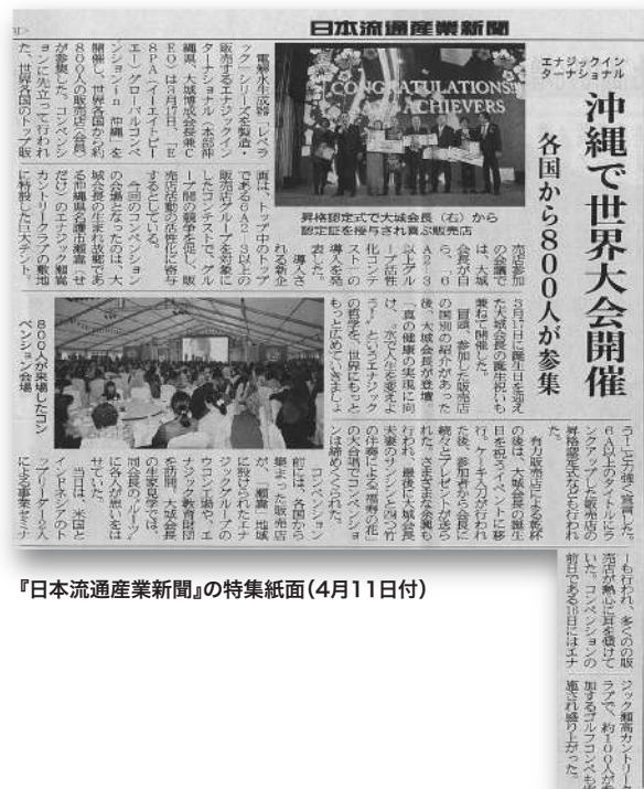
『日本流通産業新聞』の特集紙面(4月11日付)

さる3月17日に、沖縄県で開催された「E8PAグローバルコンベンション」について、流通業界の専門紙『日本流通産業新聞』が6段を費やし写真を2点載せてくわしく報じました。「エナジックインターナショナル／沖縄で世界大会開催」という大見出しを付け、前日のゴルフコンペの様相から、当日の6A2-4(以上)会議や特別セミナー、名護市に点在するエナジック関連施設訪問までを詳述。さらに、本番の「昇格認定式」と大城会長誕生祝いなども合わせて報じ、ますますグローバル化し発展するエナジックの姿を浮き彫りする記事となっています。