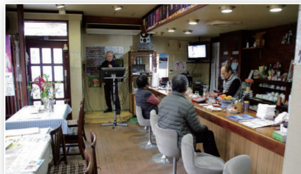
歌っているのは「チャオ友の会」の会員

酸性電解水は包丁・まな板等の台所用品の除菌用や、洗顔・うがいなどに使用し、トイレにも手洗い用に常備している。カラオケ好きの客たちは、安心安全なチャオで今日も心を込めて愛唱歌を熱唱している。