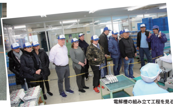
電解槽の組み立て工程を見る