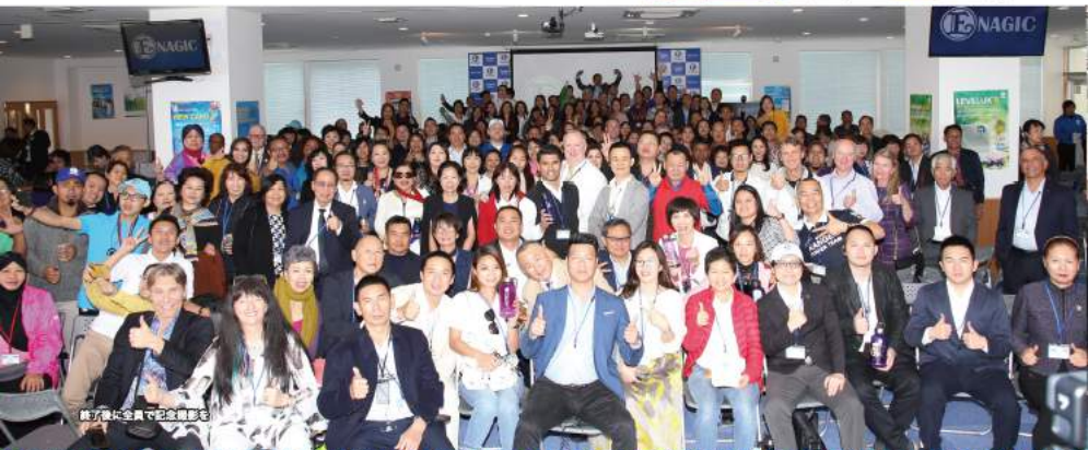
終了後に全員で記念撮影を