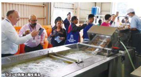
ウコンの洗浄工程を見る