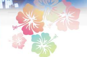
2019 EBPA GLOBAL CONVENTION IN OKINAWA awarded by MELODY SONG